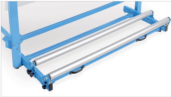
Odwijk podłogowy do belek o średnicy do 70 cm