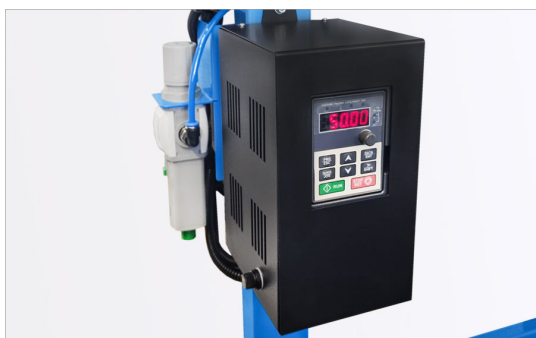
Regulacja prędkości cięcia jest niezbędna przy cięciu niektórych materiałów