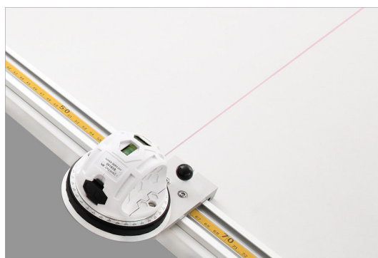
Suwak z laserem umożliwia lżejsze przesuwanie wzdłuż szyny prowadzącej