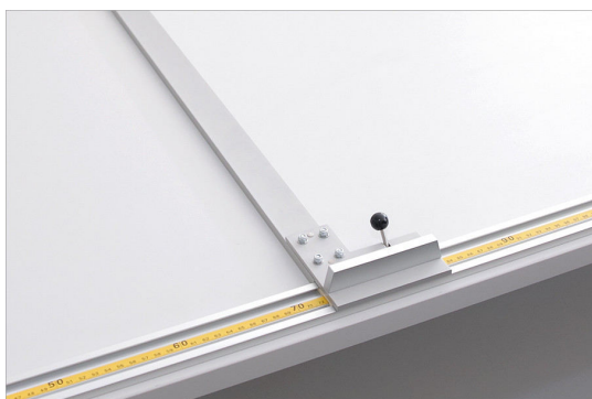
Listwa aluminiowa ułatwia odwijanie materiału do zadanej długości