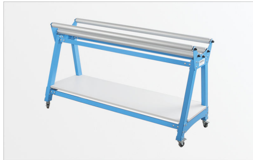
Odwijk mobilny do belek o średnicy do 45 cm